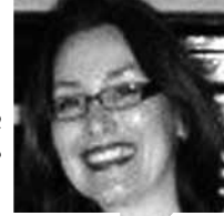
بانو گیکاریه مترجم: رها دوستدار لینک مطلب