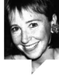
ان مک‌کلینتاک مترجم: هوشنگ راد لینک مطلب