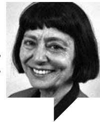
هاله افشار مترجم: آزاده جهانشاهی لینک مطلب